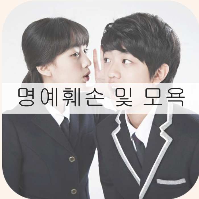
명예훼손 및 모욕

공연히 특정 사람의 사회적 가치 또는 평가를 침해할 가능성이 있는 사실 또는 허위의 사실을 적시하여 명예를 손상시키는 행위