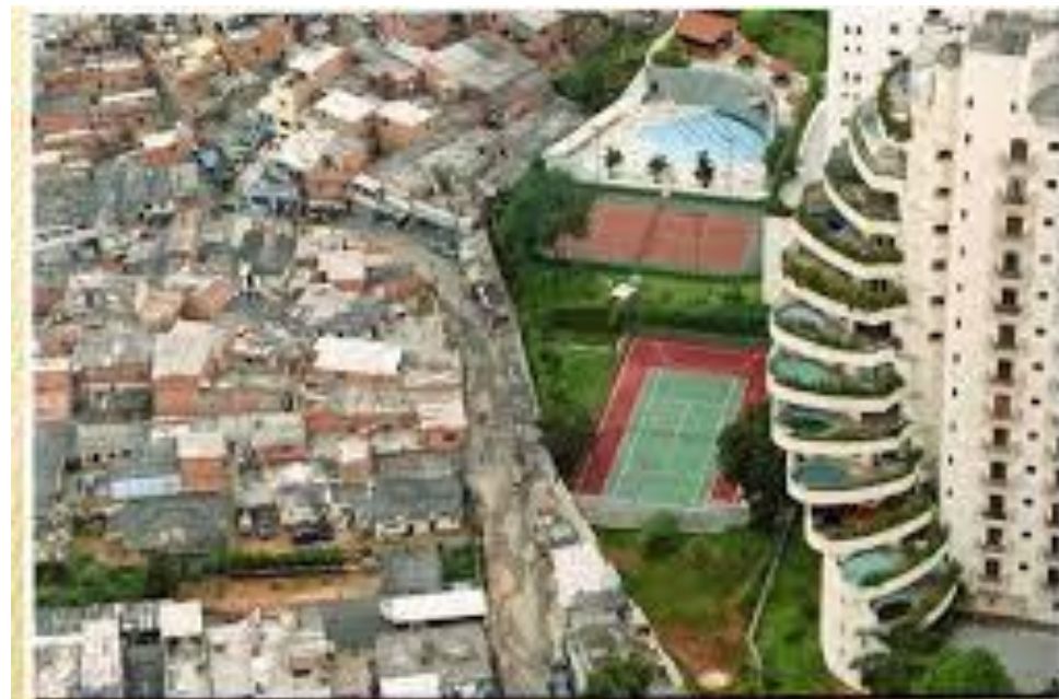
O PROCESSO DE URBANIZAÇÃO DO BRASIL

Até 1950 o Brasil era um país de população, predominantemente, rural. As principais atividades econômicas estavam associadas à exportação de produtos agrícolas, dentre eles o café. .