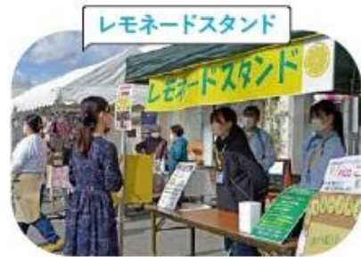
イベントに出店しレモネードを販売。 収益を小児がん支援に役立てます