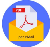
Dokumente per eMailanhang teilweise gepackt und/oder verschlüsselt