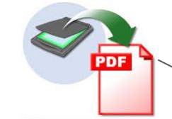
Dokumente als Papier / Scanner