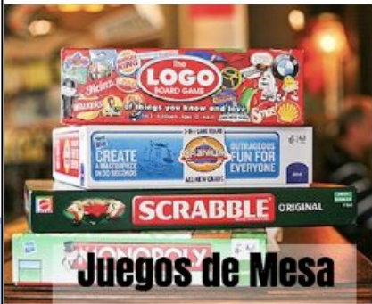
Juegos de Mesa