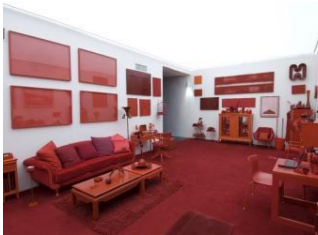
Desvio para o Vermelho (1967-84)

Imagem: Cildo Meireles / http://redefinida.blogspot.com.br/2011/11/desvio-para-o-vermelho.html / Acesso em: 28 de março de 2012.