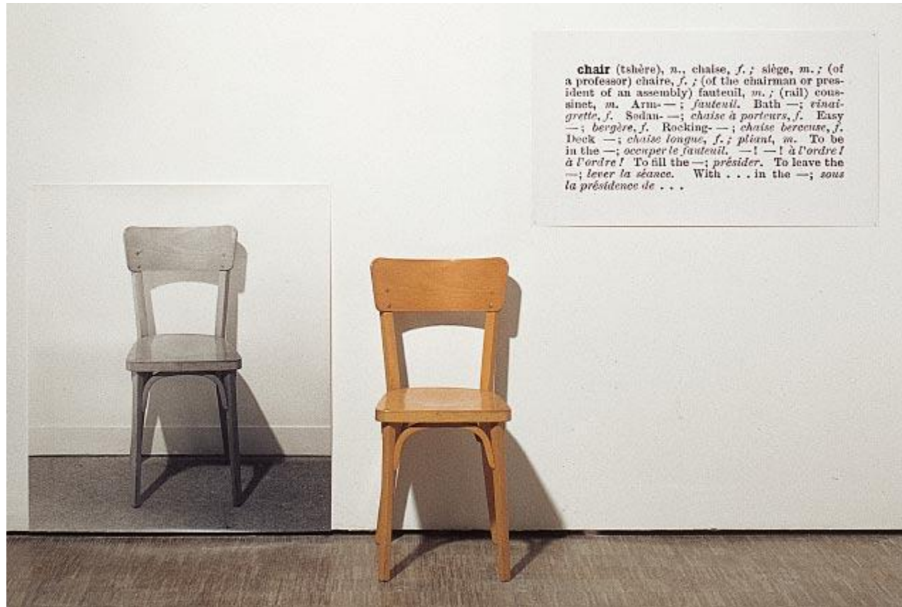
Imagem: Joseph Kosuth / http://fotografeumaideia.com.br/site/index.php?option=com_content&task=view&id=1615&Itemid=140 / Acesso em: 28 de março de 2012.

Um de seus trabalhos mais famosos é “Uma e três cadeiras”.