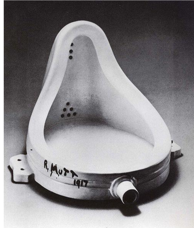
Imagem: Marcel Duchamp / United States Public Domain.