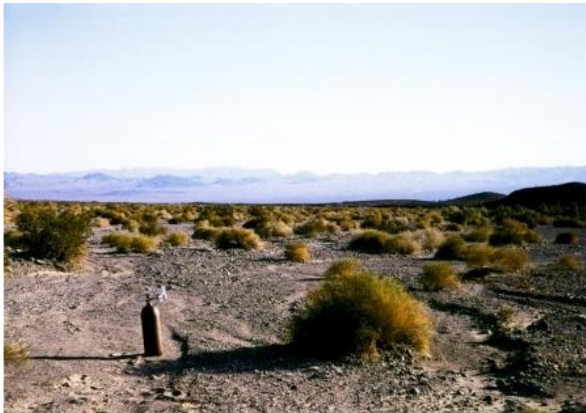
Imagem: Robert Barry / http://www.iconica.com.br/?p=3441 / Acesso em: 28 de março de 2012.