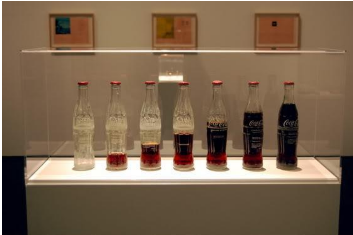
Imagem: Cildo Meireles, Insertions into Ideological Circuits: Coca-Cola Project, 1970 .

Continuando a atividade 02, como você descreveria a produção Inserções em Circuitos Ideológicos: Projeto Coca-Cola (1970) de Cildo Meireles?