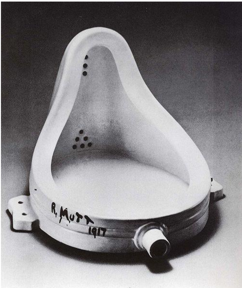
Imagem: Marcel Duchamp / United States Public Domain.

O objeto pelo objeto não é caracterizado como arte, mas o conceito, SIM!