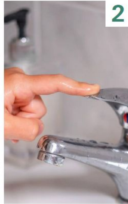
توفير استهلاك المياه