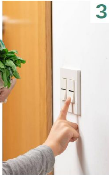
توفير استهلاك الكهرباء