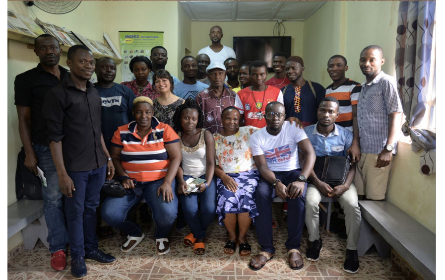
Reuniones de la plataforma comunitaria en dos asentamientos