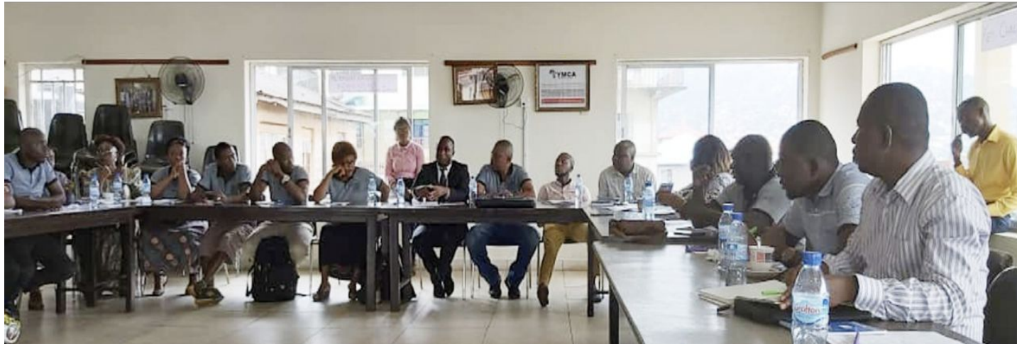
Reunión de la plataforma City leaning