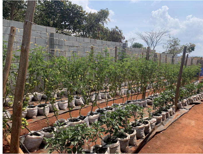
- Agricultura intensiva / estrategias resistentes a la sequía