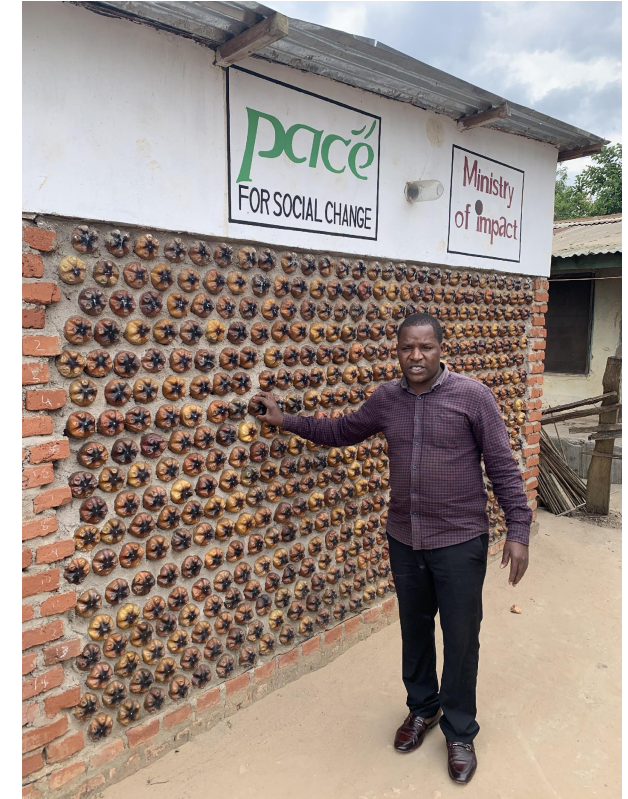
- Reducir, reutilizar, reciclar, reutilizar, etc. - De residuo a aportación útil