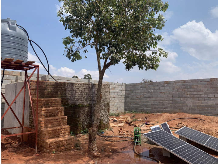
- Riego solar