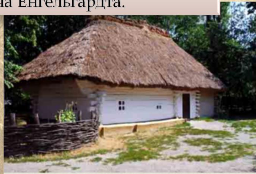
Село Моринці. Хата діда Якіма