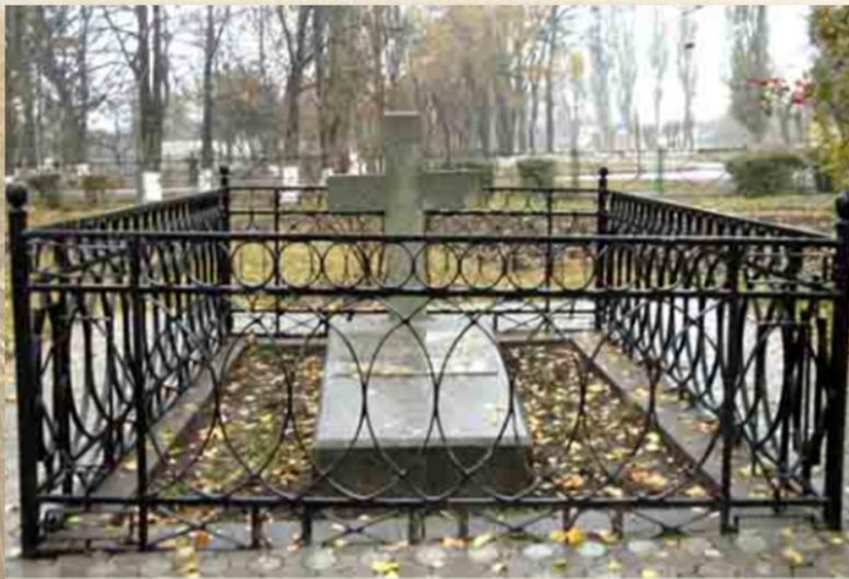
Село Шевченкове. Могила батька Шевченка

В 1825 році помер і батько Тараса. Залишившись сиротою, малий Тарас деякий час жив у дядька Павла, що став опікуном сиріт. Тут йому довелося пасти свині, працювати разом з наймитами. Тарас не витримує і переходить школярем-попихачем до кирилівського дяка, де його життя було напівголодним.