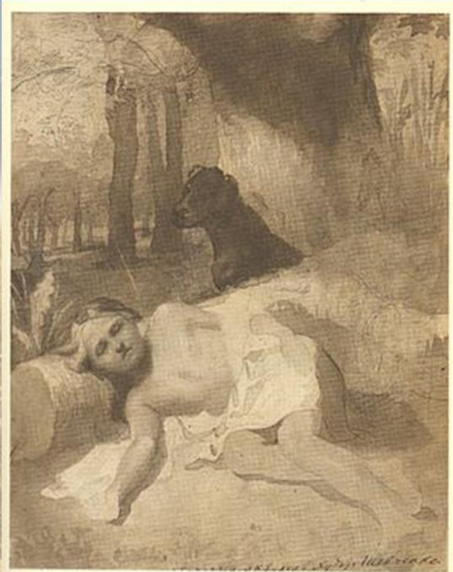
24. ХЛОПЧИК З СОБАКОЮ В ЛІСІ. Селис, 1840.

У 1840 році його нагороджено срібною медаллю 2-го ступеня за першу картину олійними фарбами "Хлопчик-жебрак дає хліб собаці".