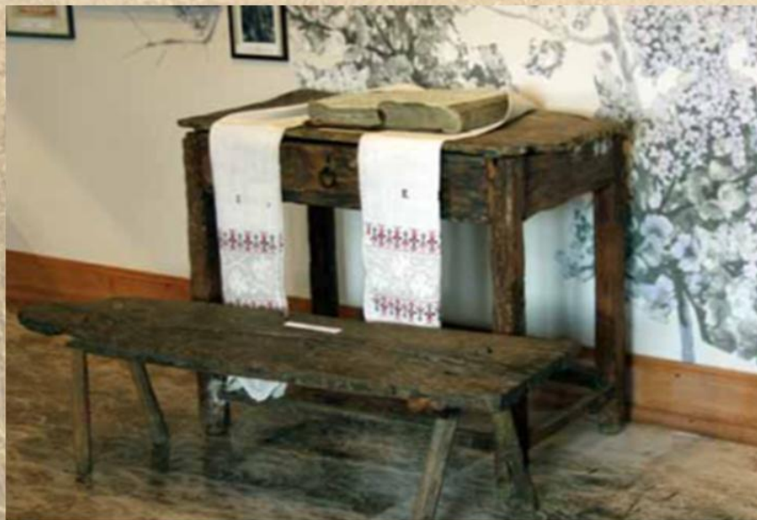
Село Шевченкове. Стіл і лава з хати батьків Т.Г. Шевченка

Через рік після народження Тараса родина переїздить із Моринців до Керелівки (нині Шевченкове).