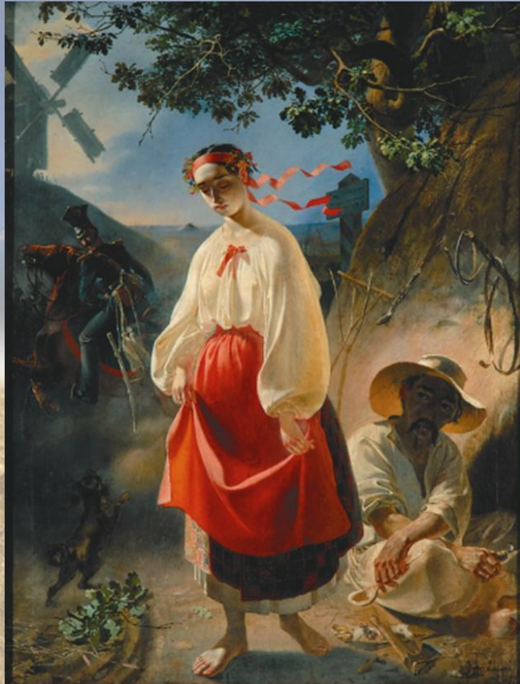
«Катерина» (1842 р.). Полотно, олія

Одночасно захоплює митця літературна творчість.