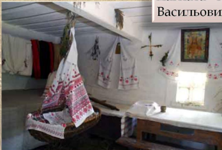
Село Моринці. Колиска у хаті Колія