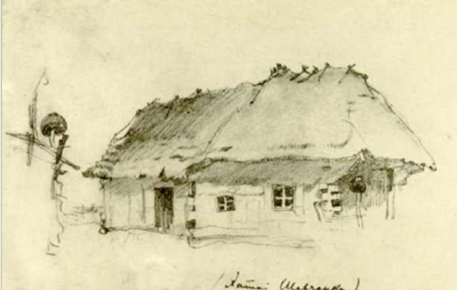
Хата Шевченків у Керелівці (Шевченкове)