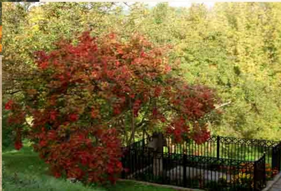
Село Шевченкове. Калина на могилі матері Шевченка