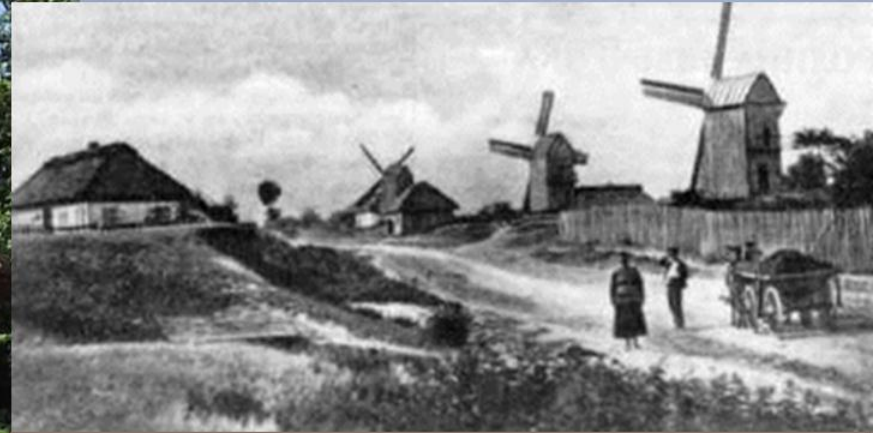
село Керелівка. Фото кінця 19-го ст.