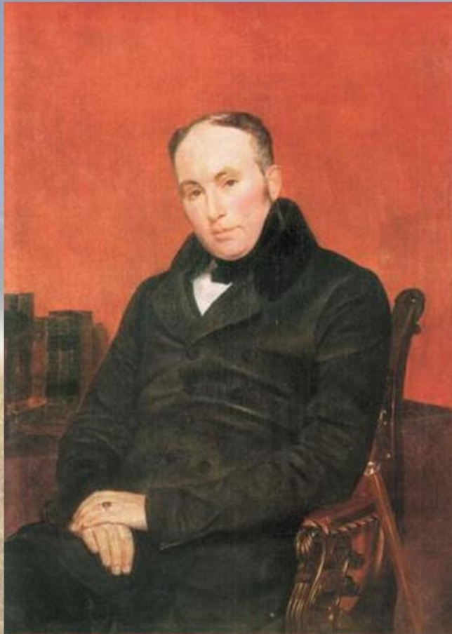
Карл Брюллов. Портрет Василя Жуковського. 1838 рік.

У лютому 1837 року Товариство заохочення художників дозволило Шевченкові (неофіційно) відвідувати навчальні класи.