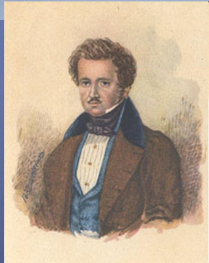
Портрет П.В. Енгельгардта. Акварель. 1833.

У 1832 році Енгельгардт законтрактував Шевченка на чотири роки Ширяєву - різних живописних справ майстру.