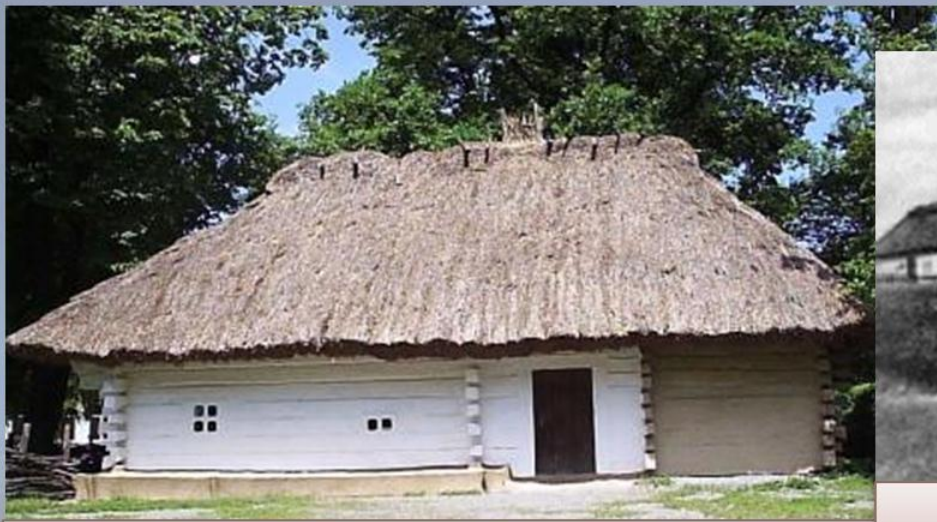
Батьківська хата в с.Керелівка. Фото нашого часу