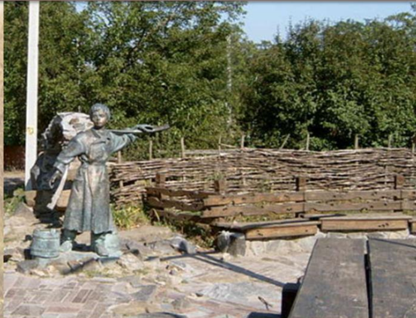
Лисянка, Черкащина. Біля Тарасової криниці - пам'ятник молодому Шевченку

У 1827 році Шевченко наймитував у кирилівського священника Григорія Кошиця.