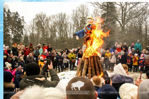
Спальванне пудзіла на Масленіцу

У апошні дзень масленічнага тыдня Нядзелю - праводзяць зіму і сустракаюць вясну песнямі, карагодамі, спальваючы пудзіла Масленіцы, якое ўвасабляе сабой усё цёмнае і негатыўнае, што было ў жыцці людзей.