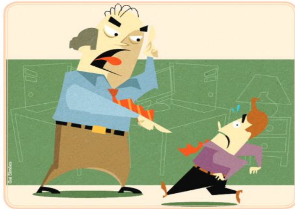
Figura 10.1: Pressão no trabalho