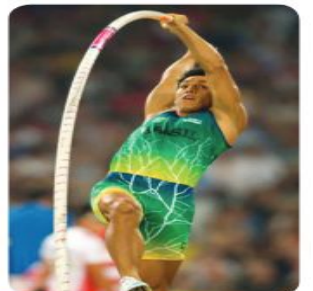
Figura 10.2: No salto com vara, ela se deforma, depois volta ao normal.

Este termo foi incorporado pela Física para designar a capacidade que alguns materiais possuem de acumular energia quando são submetidos a algum tipo de esforço e depois voltar ao seu estado normal sem qualquer deformação.