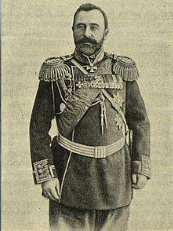
А. Н. Куропаткин