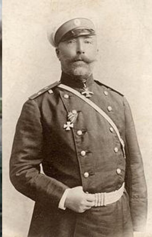
А. М. Стессель