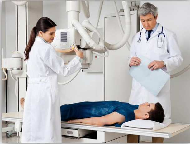
Exame diagnóstico: Radiografia