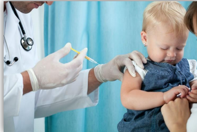
Prevenção: Vacinação infantil