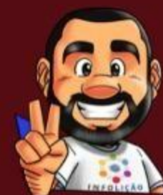
Ilustración de portada: Adinan Batista