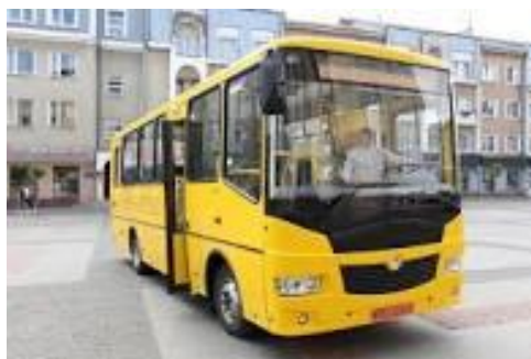
100 нових автобусів «Школяр»

Через незадовільну роботу по протидії нелегальній зайнятості та підприємствам «мінімізаторам» місцеві бюджети Львівської області недоотримують близько 250 млн. грн. , кожного місяця, які могли б бути спрямовані на соціально-економічний розвиток місцевих громад, потреби територіальної оборони, ЗСУ, підготовку укриттів, забезпечення закладів освіти. А це: