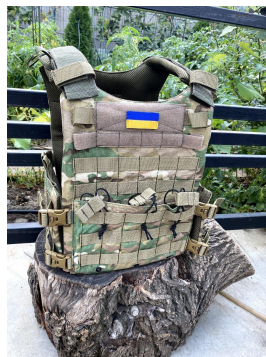
25000 нових бронежилетів 5 класу захисту