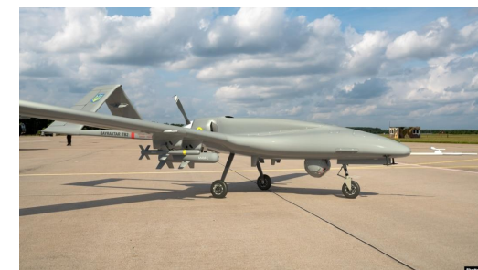
1 «Байрактар ТБ2»