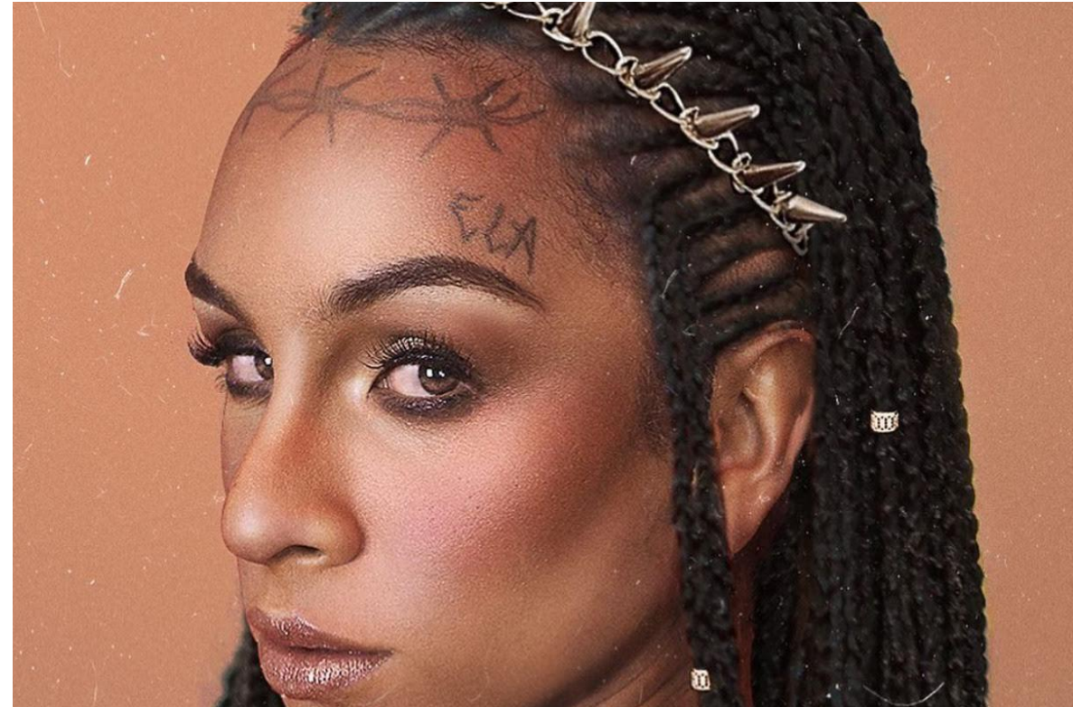
Lina Pereira dos Santos, mais conhecida como Linn da Quebrada, é uma cantora, compositora, atriz, travesti e ativista social brasileira.