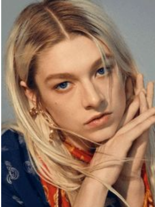
Hunter Schafer é uma modelo, atriz e ativista dos direitos LGBT estadunidense. Em 2019 ela fez sua estreia como atriz interpretando Jules na série da HBO Euphoria.

Nessa perspectiva, a identidade de um indivíduo é um processo singular e não pode ser entendida como produto de processos preconcebidos.