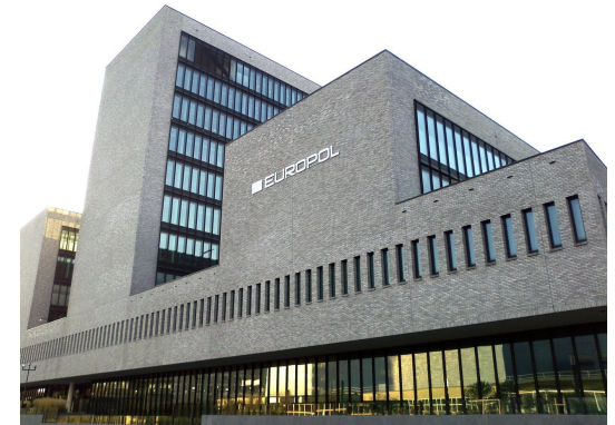
Hauptzentrale in Den Haag