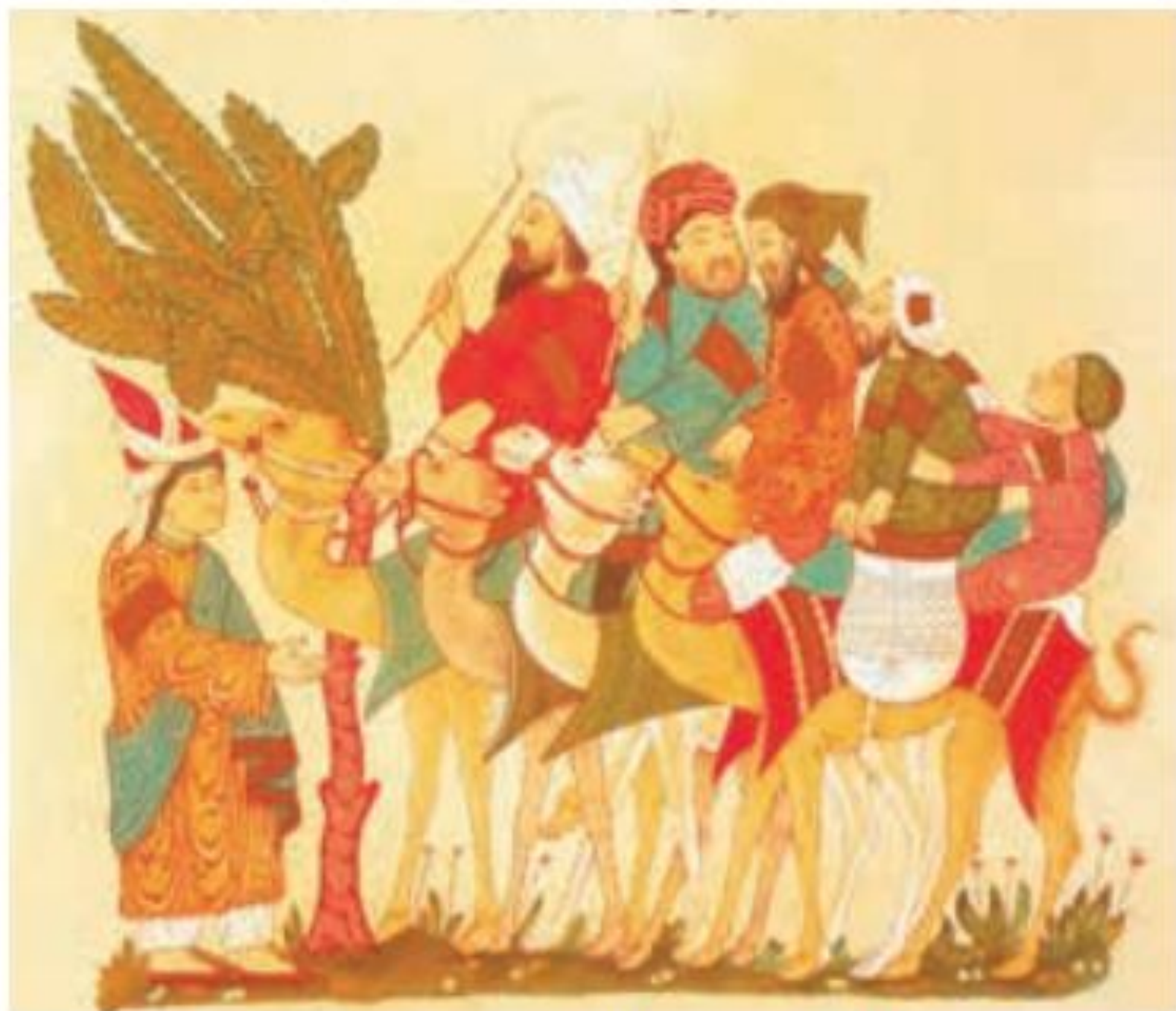
Representação árabe de uma caravana de comerciantes no deserto. 1237. Ilustração. O contato entre os mercadores árabes e os reinos do Sahel foi uma das principais vias para a introdução do islã na região. Biblioteca de Artes Decorativas, Paris.