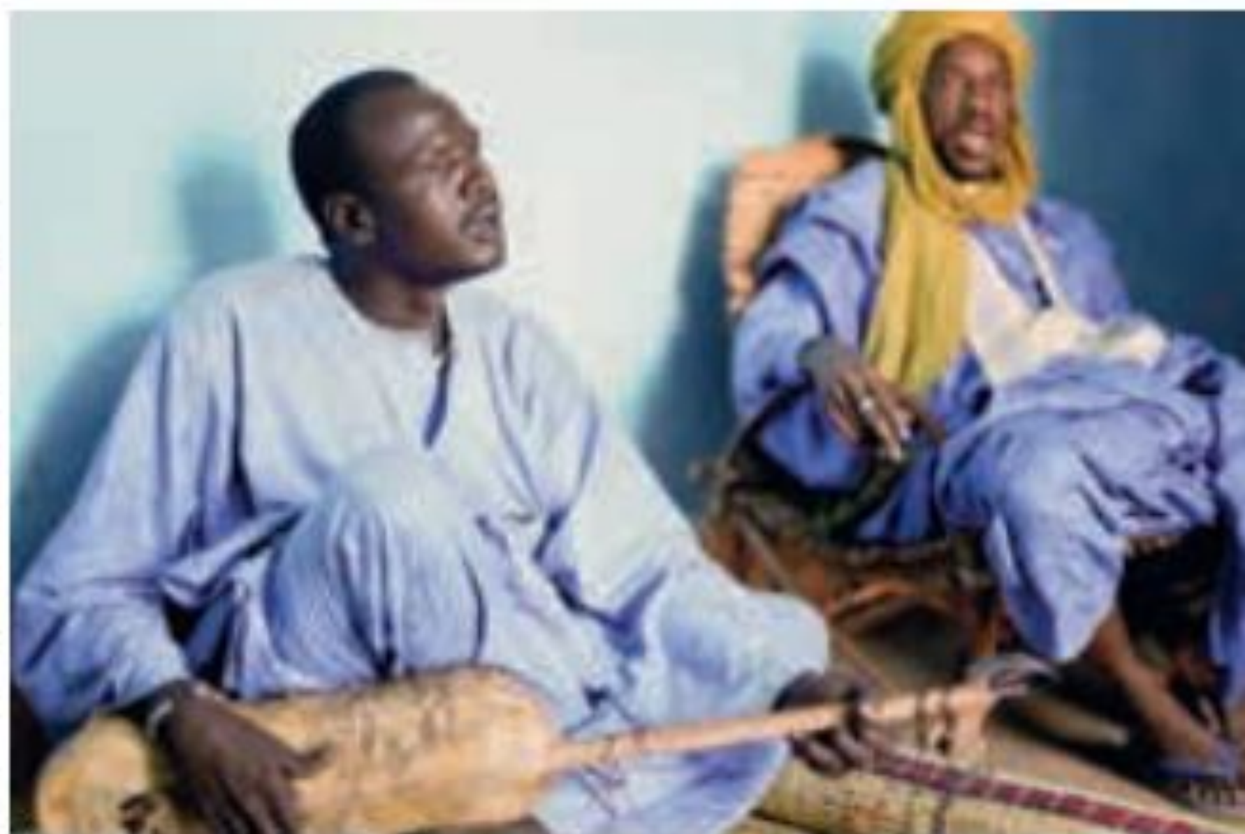
IDEVE ADPVS VAI BRVDTNACDVA

Na África, os mestres da tradição oral mais conhecidos são chamados de griots . Na fotografia, dois griots em Burkina Faso recitam histórias tradicionais acompanhadas de música e poesia. Fotografia de 2010.