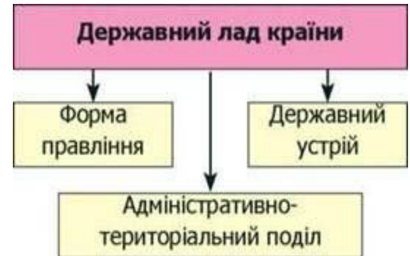
Мал. 21. Державний лад