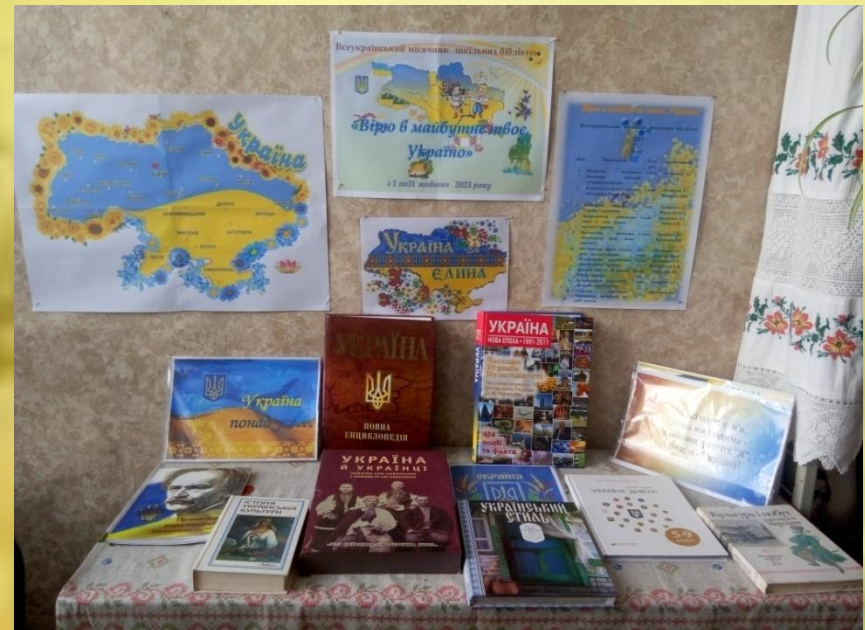
Книжкова викладка «Україна понад усе...»