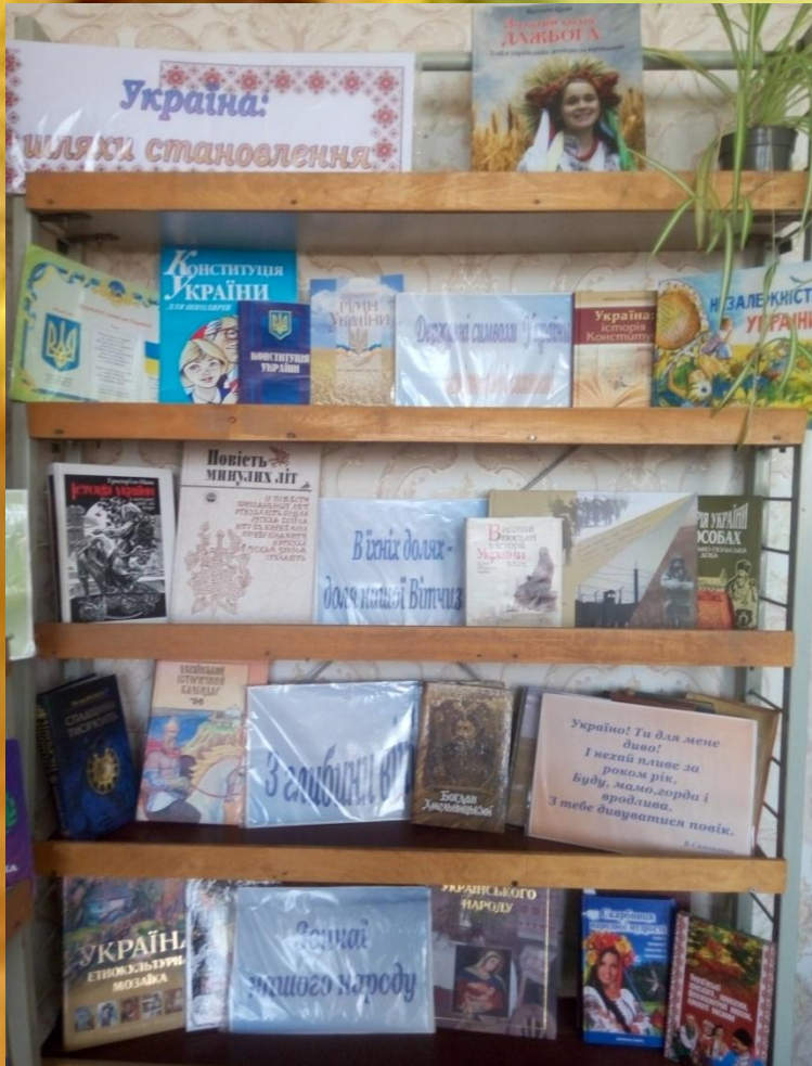
Книжкова виставка «Україна: шляхи становлення»