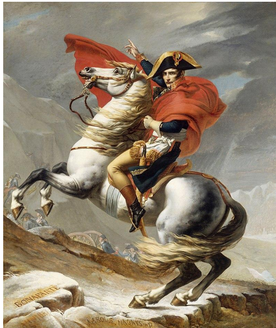
O primeiro- cônsul Napoleão cruzando os Alpes no passo de Grande São Bernardo, por Jacques-Louis David, 1800