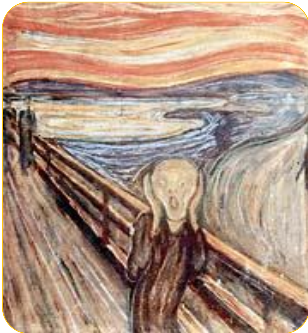
O GRITO (1893) Edvard Munch