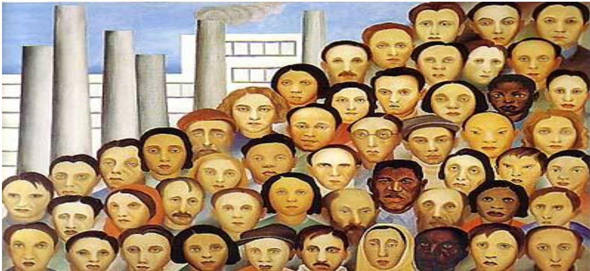
OPERÁRIOS (1933) – TARSILA DO AMARAL