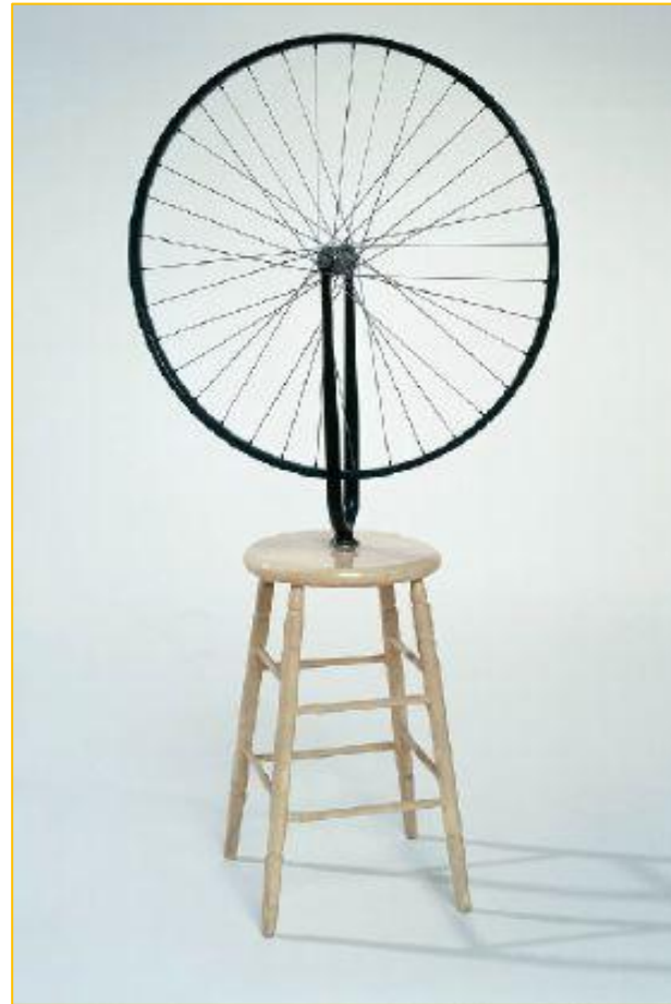
“Roda de Bicicleta” (1913) Marcel Duchamp