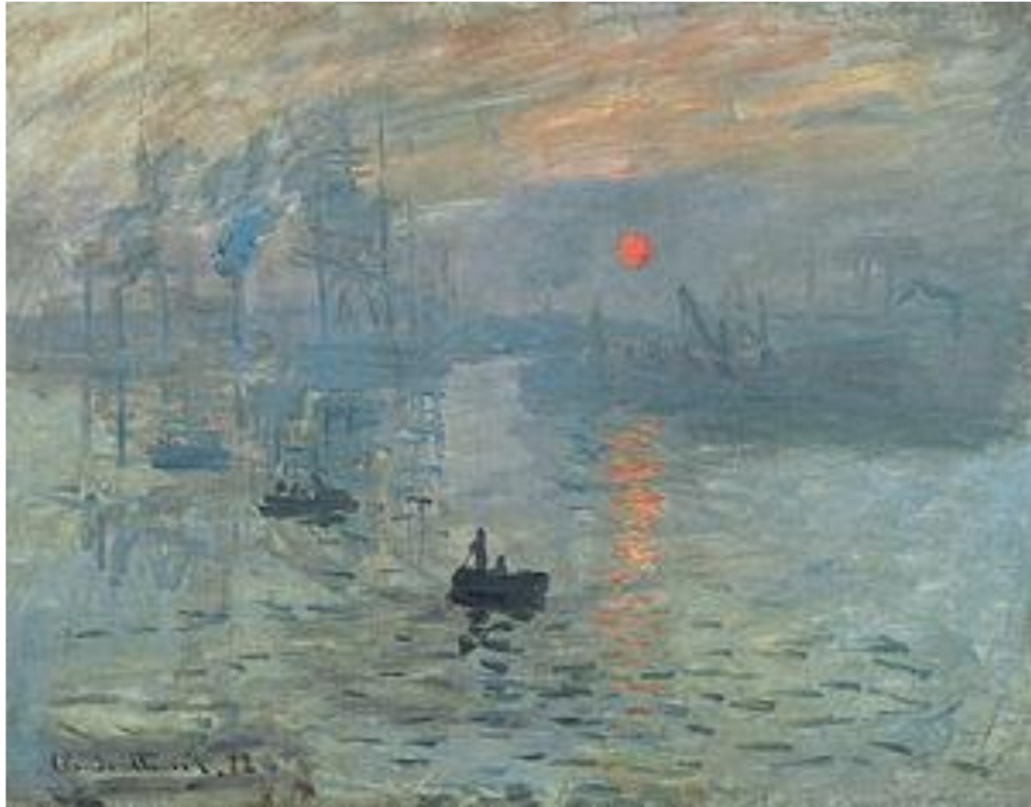
“Impressão, nascer do sol” (Claude Monet)