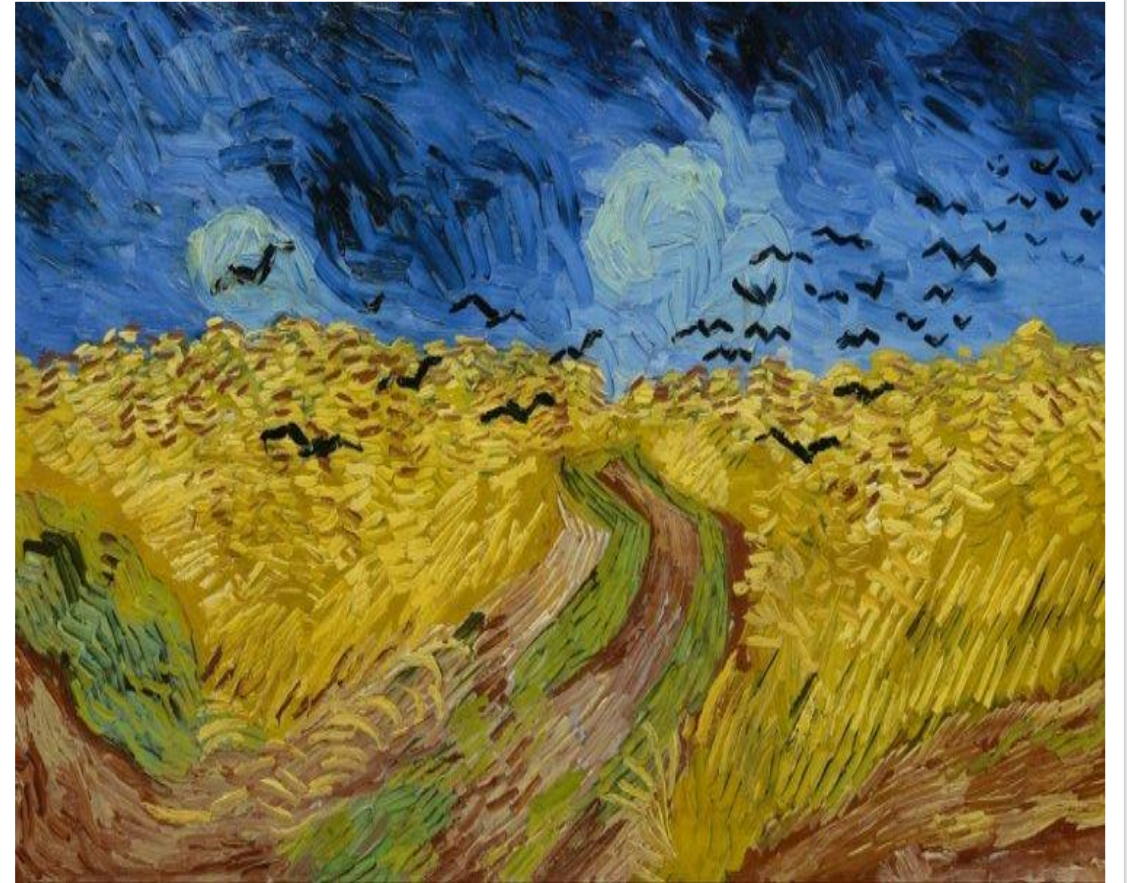
“Campo de trigo com corvos” (Vincent Van Gogh)