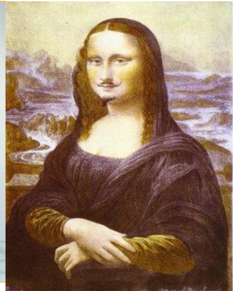
LHOOQ (1919) Marcel Duchamp