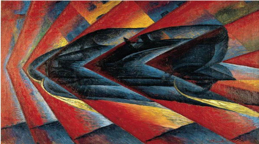
DINAMISMO DE UM AUTOMÓVEL (1913) – LUIGI RUSSOLO

PRINCIPAIS REPRESENTANTES: GIACOMO BALLA (italiano) UMBERTO BOCCIONI (italiano) CARLO CARRÁ (italiano)