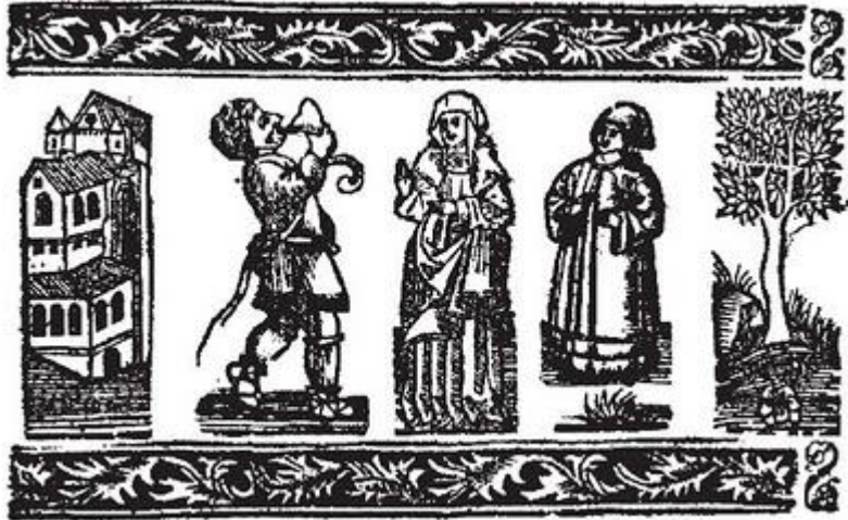
"Romance del Prisionero", pieza anónima del Cancionero de Palacio (s. XV)

-Música vocal profana: villancico e romance.