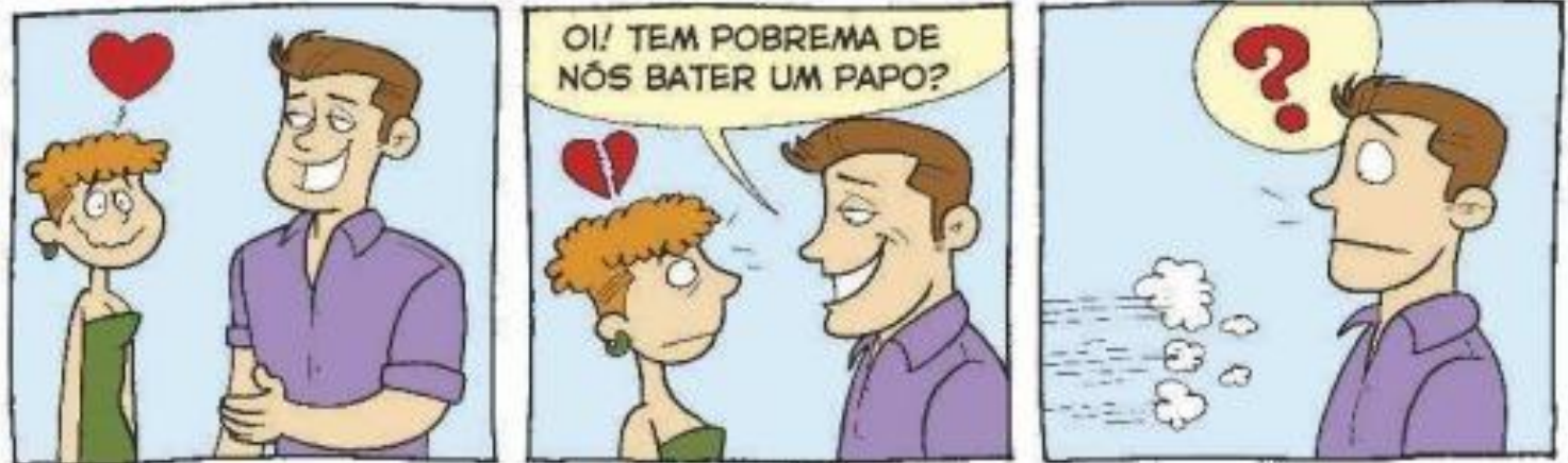
SANTOS, C. Mulher de 30 . Disponível em: http://www.mulher30.com.br . Acesso em: 7 set. 2020.