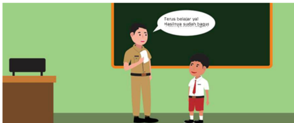
Gambar 2.18 Guru Mengapresiasi