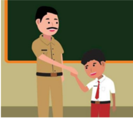
Gambar 2.22 Peserta Didik Sopan kepada Guru