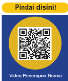
Gambar 2.16 Barcode Video

Berbagai bentuk penerapan norma yang dapat dilakukan dalam kehidupan sehari-hari peserta didik, termuat pada video penerapan norma yang dapat diakses melalui barcode video disamping ini. Guru dapat menampilkan video tersebut sebagai stimulus bagi peserta didik agar memahami materi pada unit pembelajaran 2 tentang menjadi anak hebat dengan menerapkan norma.