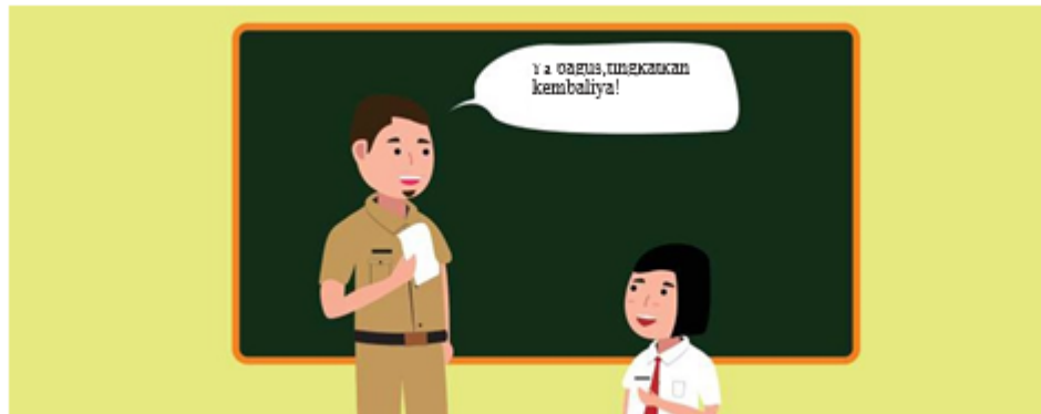
Gambar 1.19 Guru Mengapresiasi