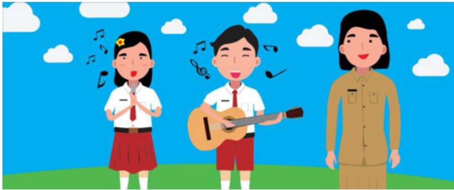
Gambar 2.17 Menyanyikan Lagu