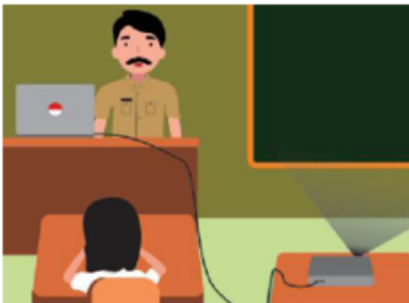
Gambar 2.20 Guru Menyajikan Video

Kegiatan pembelajaran alternatif dapat dilakukan dengan menyajikan video atau film pendek tentang konflik yang terjadi di lingkungan rumah, sekolah atau masyarakat. Jika alternatif tersebut tidak dapat dilakukan, maka guru dapat menceritakan contoh kasus terkait konflik yang terjadi di lingkungannya.