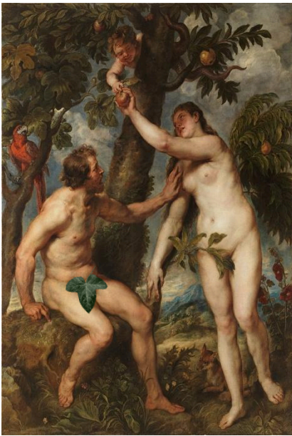
Peter Paul Rubens - Criação: entre 1628 e 1629 https://upload.wikimedia.org/wikipedia/commons/thumb/6/61/Peter_Paul_Rubens_004.jpg/800px-Peter_Paul_Rubens_004.jpg

Comenta Kardec, o casal cuja tradição se conservou sob o nome de Adão e Eva, foi dos que sobreviveram a alguns dos grandes cataclismos que revolveram em diversas épocas a superfície do globo, em certa região semítica, a cerca de 4.000 anos a.C. (LE 51), e se constituiu tronco de uma das etnias que atualmente o povoam. Muitos estudiosos, com mais razão, consideram Adão um mito ou uma alegoria que personifica as primeiras idades do mundo. Pois o povoamento da Terra não começou por um único casal Adão e Eva não foi o primeiro, nem o único a povoar a Terra. (LE 50)