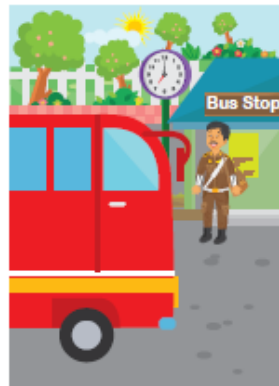
Father goes to the office at 07.00 by bus.