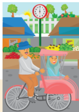
Mother goes to the market at 06.00 by pedicab.