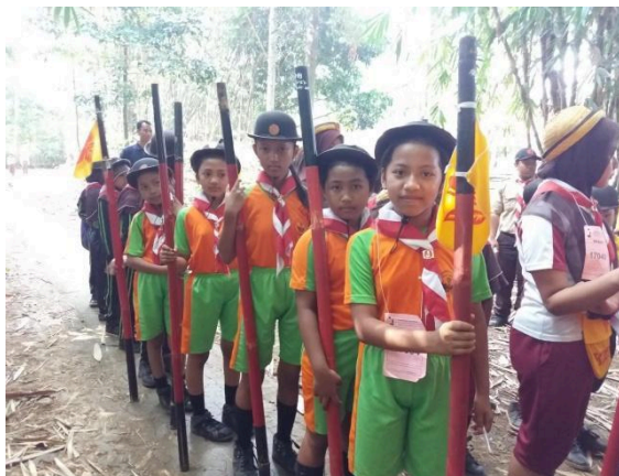
Figure 1. Scouting Activities For Elementary School Students