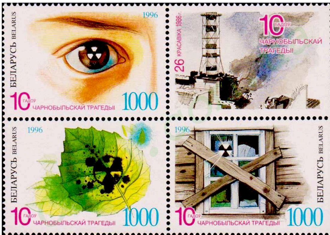
Почтовая марка, 1996 г