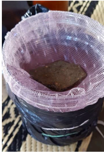
Gambar 1. Ecovitrak dalam rumah