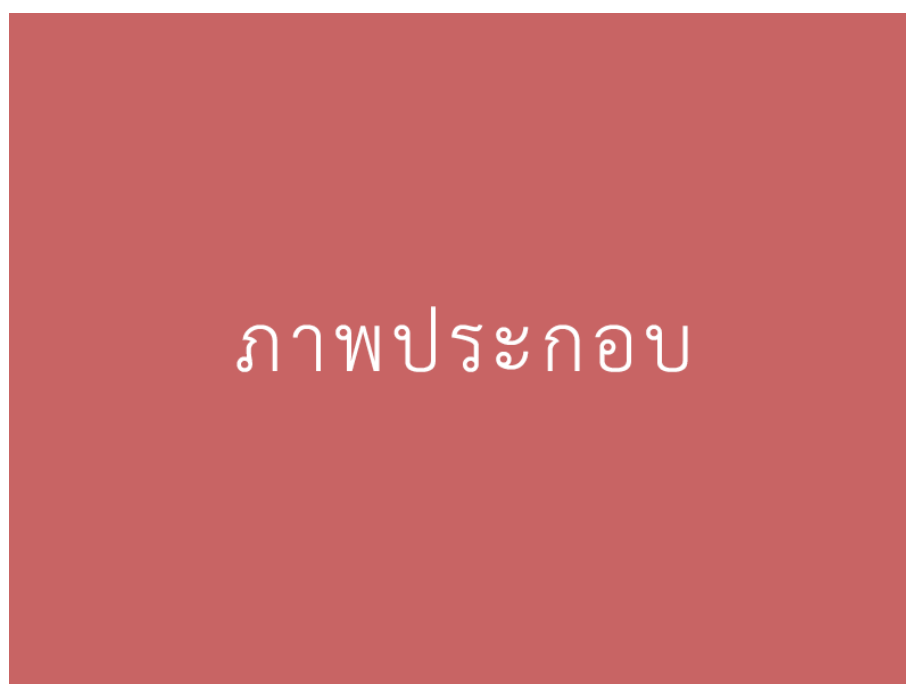
รูปภาพที่ 2 : คำบรรยายใต้ภาพ 2 มีรูปภาพประกอบ (ถ้ามี)