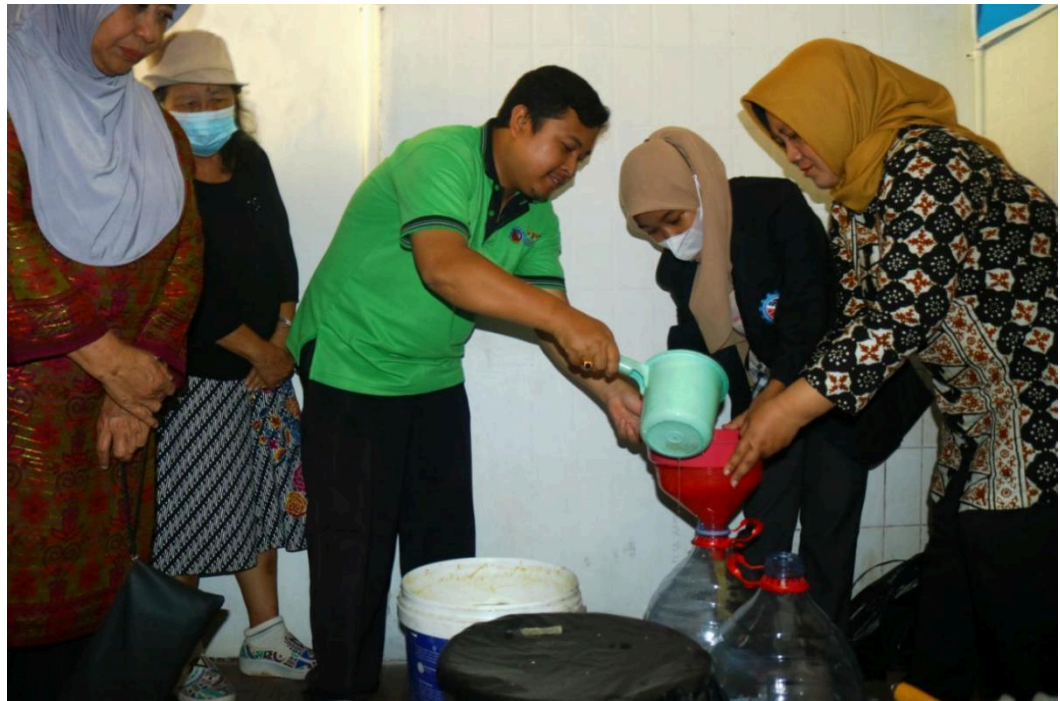
Gambar 3. Pembelajaran Bersama Pembuatan Granul bersama Warga

Pada gambar 3 adalah kegiatan pembuatan granul dari bahan echo enzyme bersama warga, dari tahap ini bahan limbah sampah rumah tangga di olah menjadi pupuk yang bisa di