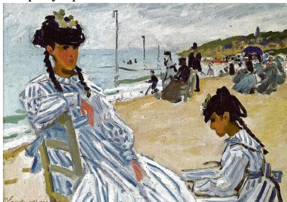
Клод Моне «На пляже Трувиля»