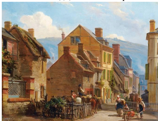
Шарль Луи Мозин «The rosiers street in Trouville»

На вилле Монтебелло, построенной в 1866 году сейчас находится музей с экспозициями картин Шарля Луи Мозина. Как говорят, именно Мозин «открыл» Трувиль. Он рисовал Трувиль еще в 1852-ом году. После выставки его картин, в город потянулись и другие художники и писатели, включая Моне, Дюма и Флобера. Вместе с ними к городу пришли слава и известность.