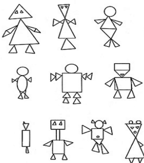
Рис. 1. Виды изображений к тесту: “Конструктивный рисунок человека из геометрических фигур”

8 слайд. Примеры рисунков, которые у вас могут получиться.