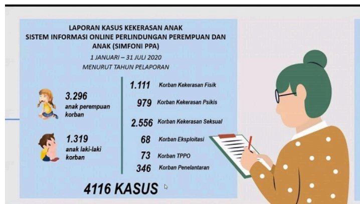
Gambar 1. Nama Gambar