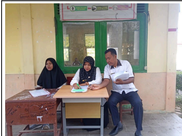
Gbr 1. Menyesuaikan jadwal penggantian sesuai dengan mata pelajaran dan kelas yang ditinggalkan oleh guru utama