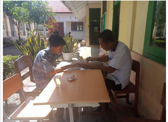
Gbr 6. Memberikan perhatian khusus terhadap siswa yang membutuhkan perawatan kesehatan