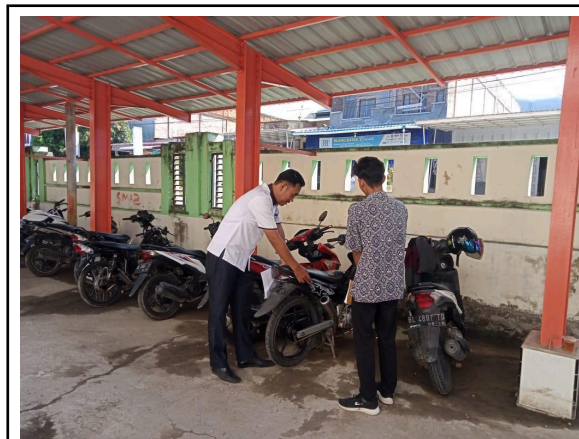
Gbr 1. Merespons secara tegas terhadap pelanggaran ketertiban dengan menasehati motor siswa yang knalpot suara besar