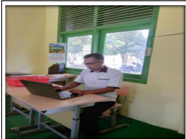
Gbr 1. Memebuat Laporan hasil piket