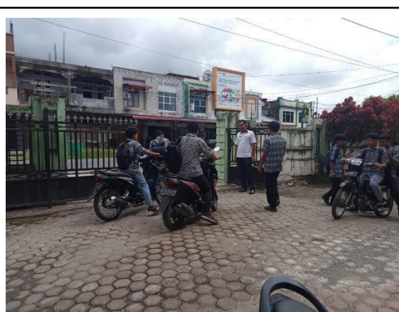
Gbr 2. Memastikan semua siswa meninggalkan sekolah di saat jam pulang sekolah dengan tertib