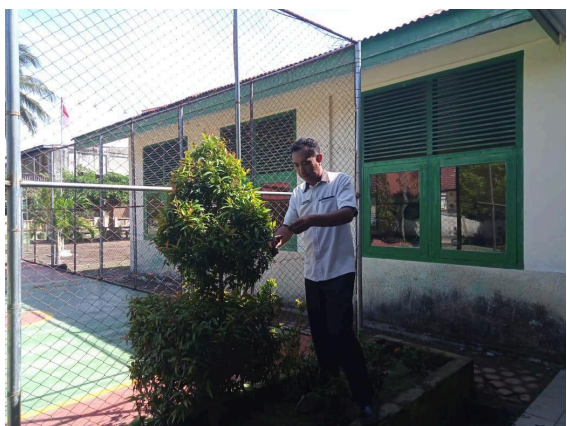
Gbr 2. Menjaga taman dan area hijau sekolah agar tetap terawat dan indah