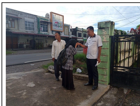
Gbr 1. Menjemput siswa di pagi hari di depan gerbang sekolah