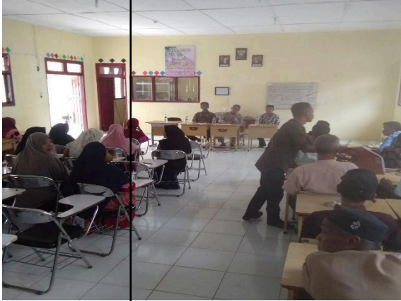
Gbr 5. Membangun hubungan yang baik dengan komite sekolah dan orang tua