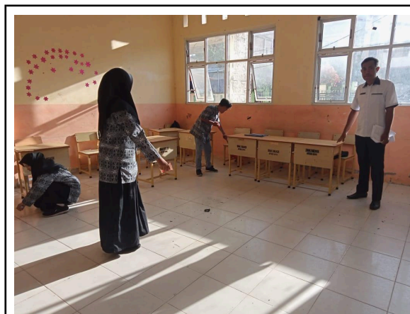
Gbr 1. Mendorong siswa untuk menjaga kebersihan diri dan lingkungan sekitar dengan memungut sampah