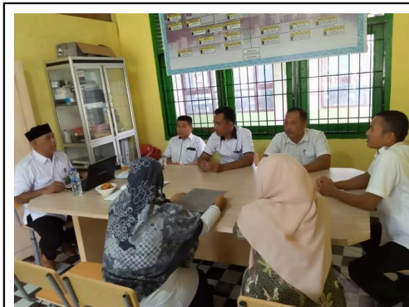
Gbr 1. Menunjukkan sikap peduli dan keramahan kepada tamu, memberikan kesan positif terhadap pengalaman kunjungan mereka di sekolah