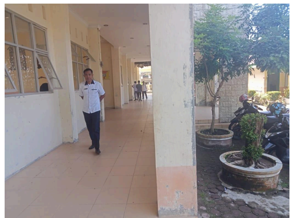
Gbr 2. Melakukan patroli rutin di area sekolah untuk mengawasi keamanan dan mencegah kejadian yang tidak diinginkan