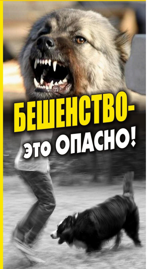
Иллюстрация: УМНГ "Друг" г. Брянск, 2016 г. — ИЛЛЮСТРАЦИОННОЕ ИЗДАНИЕ, стр. 406-407.