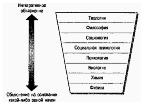
Рис. 1.1. Частичная иерархия дисциплин. Диапазон дисциплин — от базовых наук, изучающих основополагающие законы природы, до интегративных, изучающих сложные системы. Один уровень успешного объяснения функционирования человека не противоречит другим уровням объяснения

В США идея прогресса узаконила социальные науки как своеобразных «консультантов» для обеспечения рационального течения истории (Ross, 1984). Методы социального управления внедрялись для того, чтобы организовать людей и их мысли и установки, эмоции и практику.