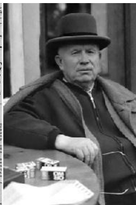
Передовица "Правды" от 16 октября 1964 года Н.С. Хрущев - пенсионер

правилам. Еще накануне переворота все будущие посты были распределены. Первоначальная поддержка первого секретаря партийным аппаратом объяснима его деятельностью по десталинизации, прекращению чисток, установлению более или менее стабильной системы.