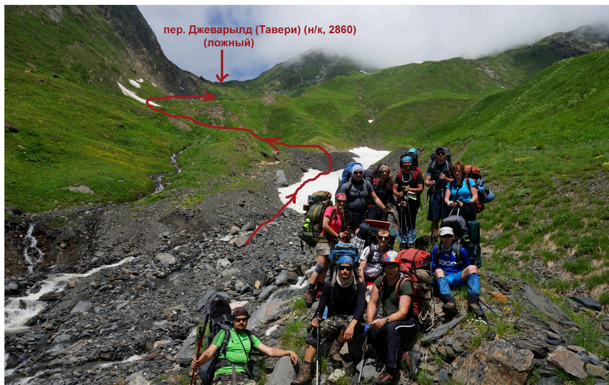
рис. 02 ровная площадка перед ложным перевалом (рекомендуемое место для стоянки)