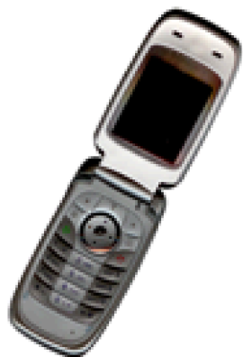
Gambar 2. Contoh gambar dengan resolusi kurang

sedangkan keterangan gambar yang lebih dari satu baris harus dirata kiri (misalnya Gambar 1). Keterangan gambar dengan nomor gambar harus ditempatkan sesuai dengan poin-poin yang relevan, seperti ditunjukkan pada Gambar 1 – 3, kecuali jika gambar berukuran besar melebihi satu kolom.