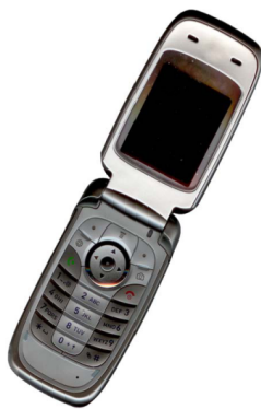
Gambar 3. Contoh gambar dengan resolusi cukup