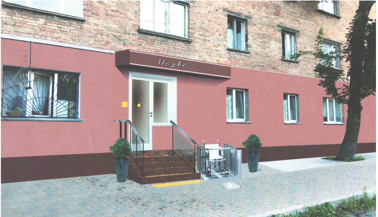
СХЕМА БЛАГОУСТРОЮ ПРИЛЕГЛОЇ ТЕРИТОРІЇ