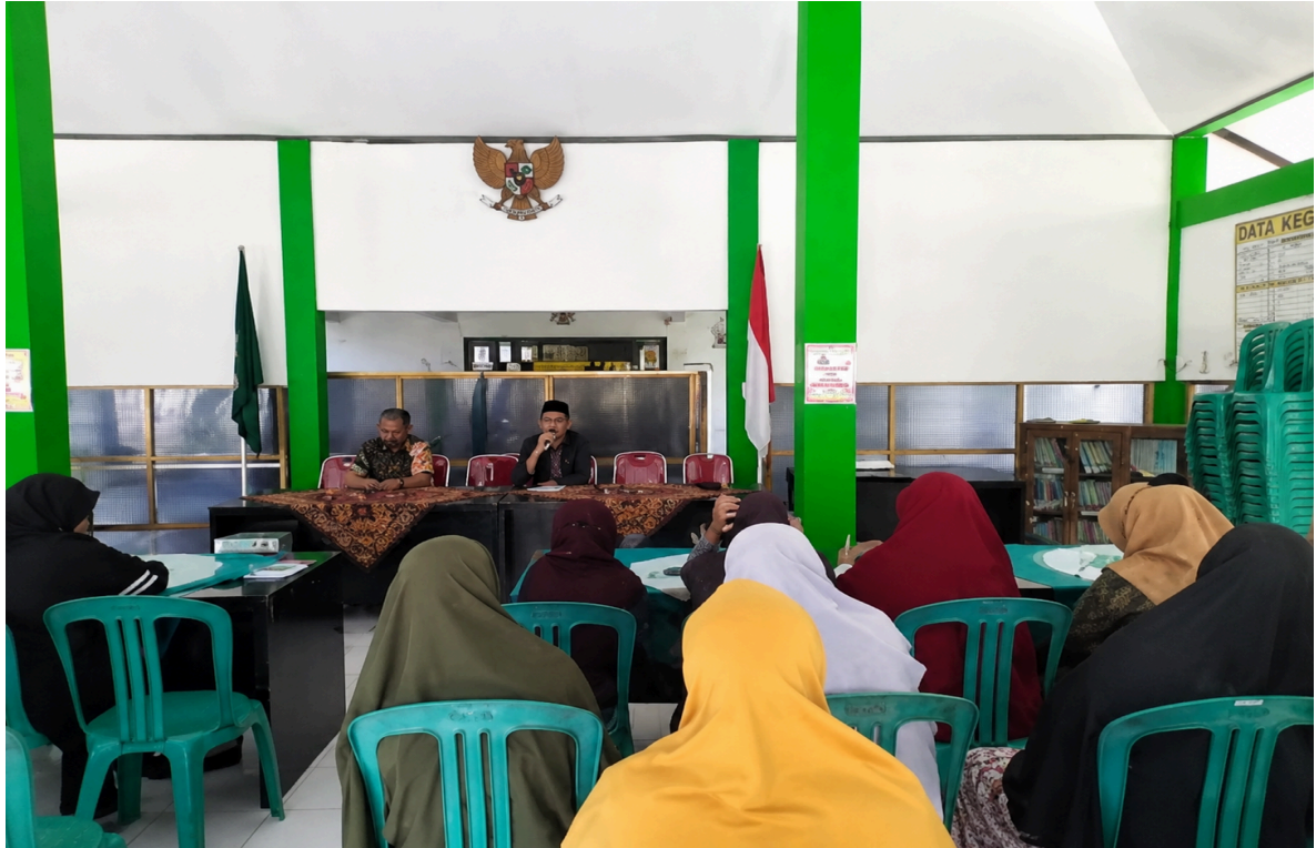
Foto Proses Pembuatan Website