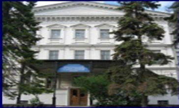
Государственный художественный музей