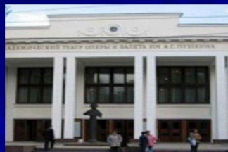
Театр оперы и балета имени Пушкина