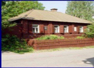
Музей детства А.М. Горького "Домик Каширина"