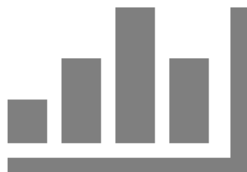
Gambar 1. Nama Grafik

Angka-angka di dalam tabel tidak boleh diulang-ulang dalam narasi verbal baik sebelum maupun sesudahnya.