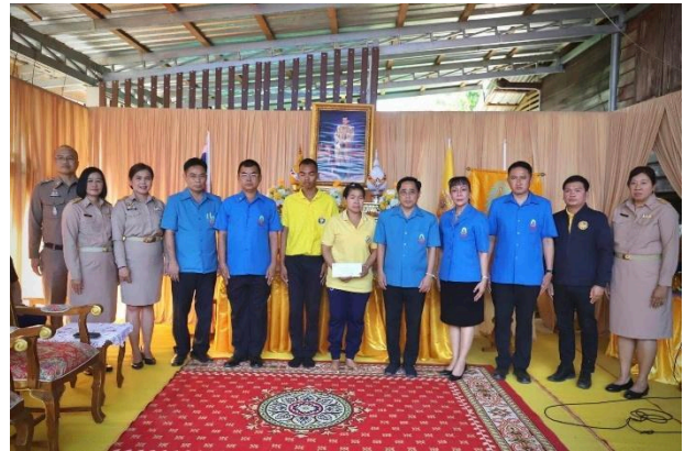
รายงานการปฏิบัติราชการประจำเดือน