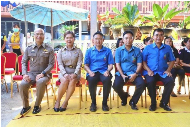
ข้อมูล ณ. วันที่ 20 มีนาคม 2568