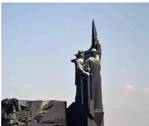
Монумент «Твоим освободителям, Донбасс!»

Уважаемые обучающиеся! 8 сентября в нашем крае отмечается праздник, который по важности можно сравнить с Днем Победы. Это День освобождения Донбасса от немецко-фашистских захватчиков. В 1943 году во время Донбасской наступательной операции в этот день советские войска освободили областной центр – город Сталино (ныне Донецк).