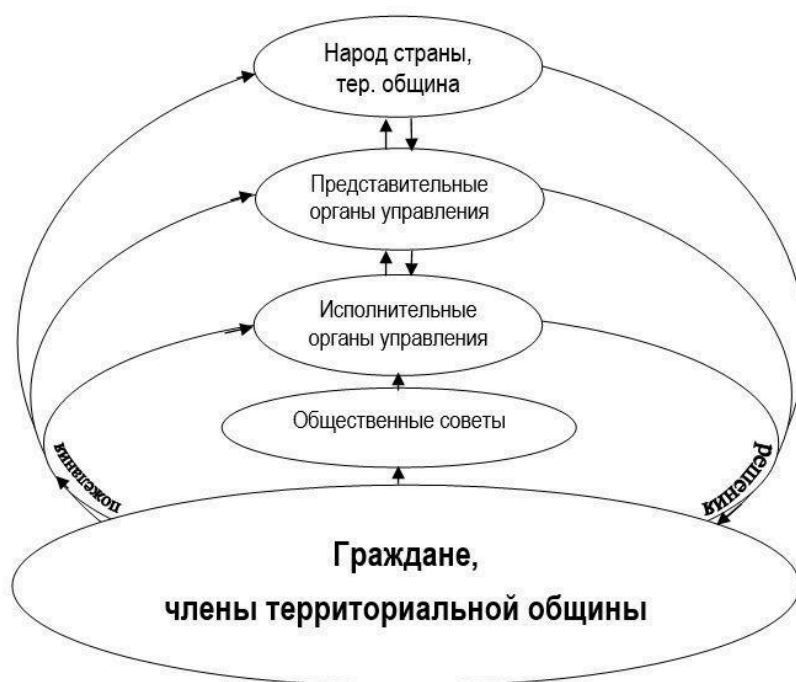
Рис. Общая схема общественного самоуправления

Общественное самоуправление реализуется на всех уровнях территориальной самоорганизации граждан в соответствии с административно-территориальным структурированием страны, начиная с лестничной площадки, подъезда, территориальной общины многоквартирного дома или улицы в частном секторе до общегосударственной территориальной общины - народа страны. Формы (схемы) самоуправления у самоорганизовавшихся общин могут быть разными, по желанию самих общин при условии соблюдения в них прав человека и гражданина. Типовая схема общественного самоуправления на уровне страны и на каждом уровне административно-территориального деления, начиная с территориальных общин населенных пунктов и их внутренних структурных образований представлена на нижеприведенном рисунке.