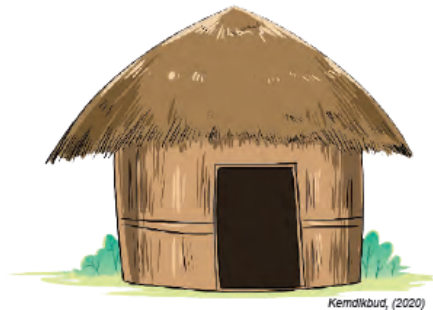
Gambar Ilustrasi 1.6 Menenal keragaman budaya melalui rumah adat daerah