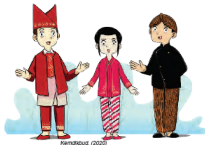
Gambar Ilustrasi 1.5 Mengenal keragaman budaya melalui pakaian adat daerah