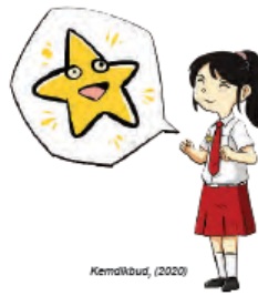
Gambar Ilustrasi 1.12 memberi reward untuk menghargai pencapaian peserta didik

Selain mempersiapkan media pembelajaran tersebut, guru dapat menyusun pedoman instruksional game Puzzle kata seperti di bawah ini: