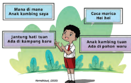
Gambar Ilustrasi 1.11 Meningkatkan kemampuan kosakata dan hafalan melalui tebak lagu

Penjelasan di atas adalah pijakan dan argumentasi dasar mengapa pembelajaran mengkategorikan lagu nasional dan lagu daerah menggunakan pendekatan tebak lagu. Pada kegiatan pembelajaran 4 sangat penting bagi peserta didik Fase A dalam meningkatkan kemampuan kosakata dan hafalan, sekaligus membangun fondasi kesadaran keberagaman dan fondasi nasionalisme sejak dini.