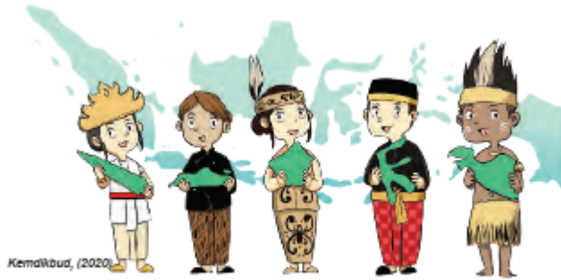
Gambar Ilustrasi 1.4 Menyanyi lagu daerah untuk mengembangkan rasa percaya diri

Indonesia. Pada pembelajaran 2, peserta didik harus mendapatkan kesempatan untuk menikmati produk musik daerah dan juga berpartisipasi dalam memahami makna keberagaman musik Indonesia.