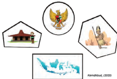
Gambar Ilustrasi 1.10 Melihat ikon dan simbol untuk mengingat lagu