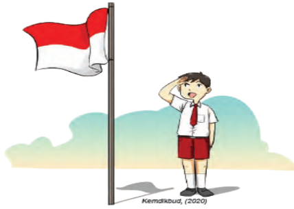
Gambar Ilustrasi 1.2 Menyanyikan lagu Indonesia Raya saat upacara