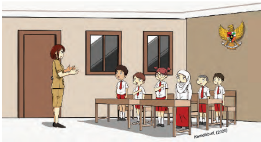
Gambar Ilustrasi 1.1 Menyanyi sebagai salah satu cara menumbuhkan rasa nasionalisme