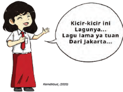
Gambar Ilustrasi 1.9 Peserta didik diajak mengenal lagu daerah dan lagu nasional

Nyanyikan salah satu lagu nasional dan daerah yang kamu sukai!