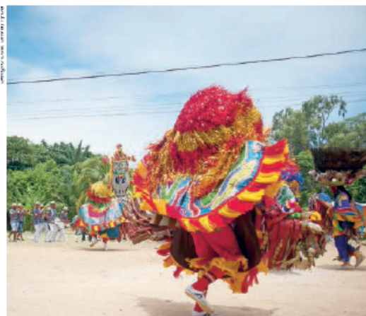
Figura 4. Apresentação de Maracatu em Olinda (PE), 2018.

festividades, como o Carnaval, a Festa Junina, o Maracatu, o Bumba meu boi ou Boi-bumbá também resultam de influência portuguesa (figuras 4 e 5). Na alimentação, pratos como a bacalhoadada e doces como o quindim vêm da tradição culinária portuguesa.