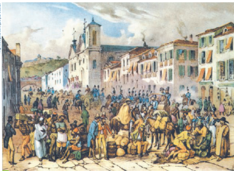
Figura 3. Rua Direita, de Johann Moritz Rugendas, 1835 (litografia). Na obra, é possível identificar a presença de colonos europeus e africanos escravizados no centro da então capital do Império, o Rio de Janeiro (RJ).

Dicas de pesquisa e aprofundamento do componente