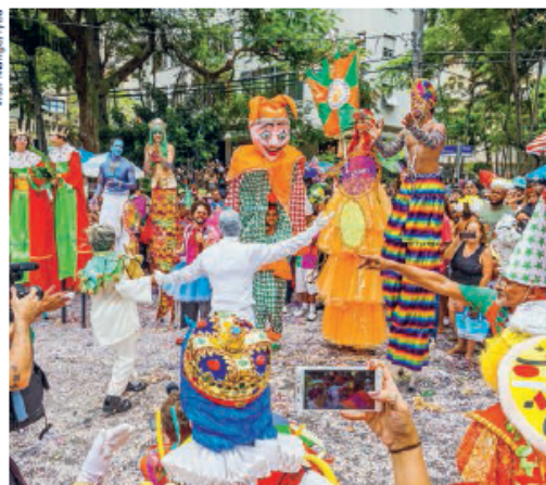
Figura 5. Bloco de Carnaval no Rio de Janeiro (RJ), 2018.